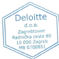
Katarina Kadunc Direktor i ovlašten revizor

Uprava i Nadzorni odbor Društva odgovorni su za objavljivanje Izvještaja o primicima na web stranici Društva kao i za točnost sadržanih podataka. Opseg našeg obavljenog posla ne uključuje pregledavanje navedenoga te ne preuzimamo nikakvu odgovornost za bilo kakve izmjene i dopune do kojih bi moglo doći u Izvješću o primicima na temelju Izvješća neovisnog revizora s izražavanjem ograničenog uvjerenja ili bilo kakve razlike između izvješća koje smo izdali i podataka prikazanih na web stranici Društva.